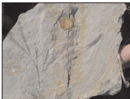
Liść miłorzębu i pionowy przekrój korzenia rośliny

2. Uporządkuj kolejność zapisanych w tym profilu zdarzeń geologicznych, wpisując w kółka odpowiednie litery (zdarzenia mogą się powtarzać):